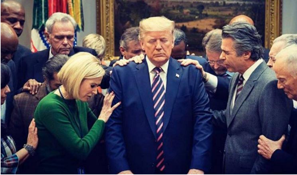
Evangelikaalit rukoilemassa Trumpille siunausta.

Tätä kirjoitettaessa on vajaa kuukausi USA:n presidentinvaaleihin. Jos nykyinen eli Trump häviää, voi se indikoida USA:n evankelikaalien vaikutusvallan vähentymistä. Tai sitten vain Trumpin ensimmäinen kausi on tehnyt selvää tämän uskottavuudesta.