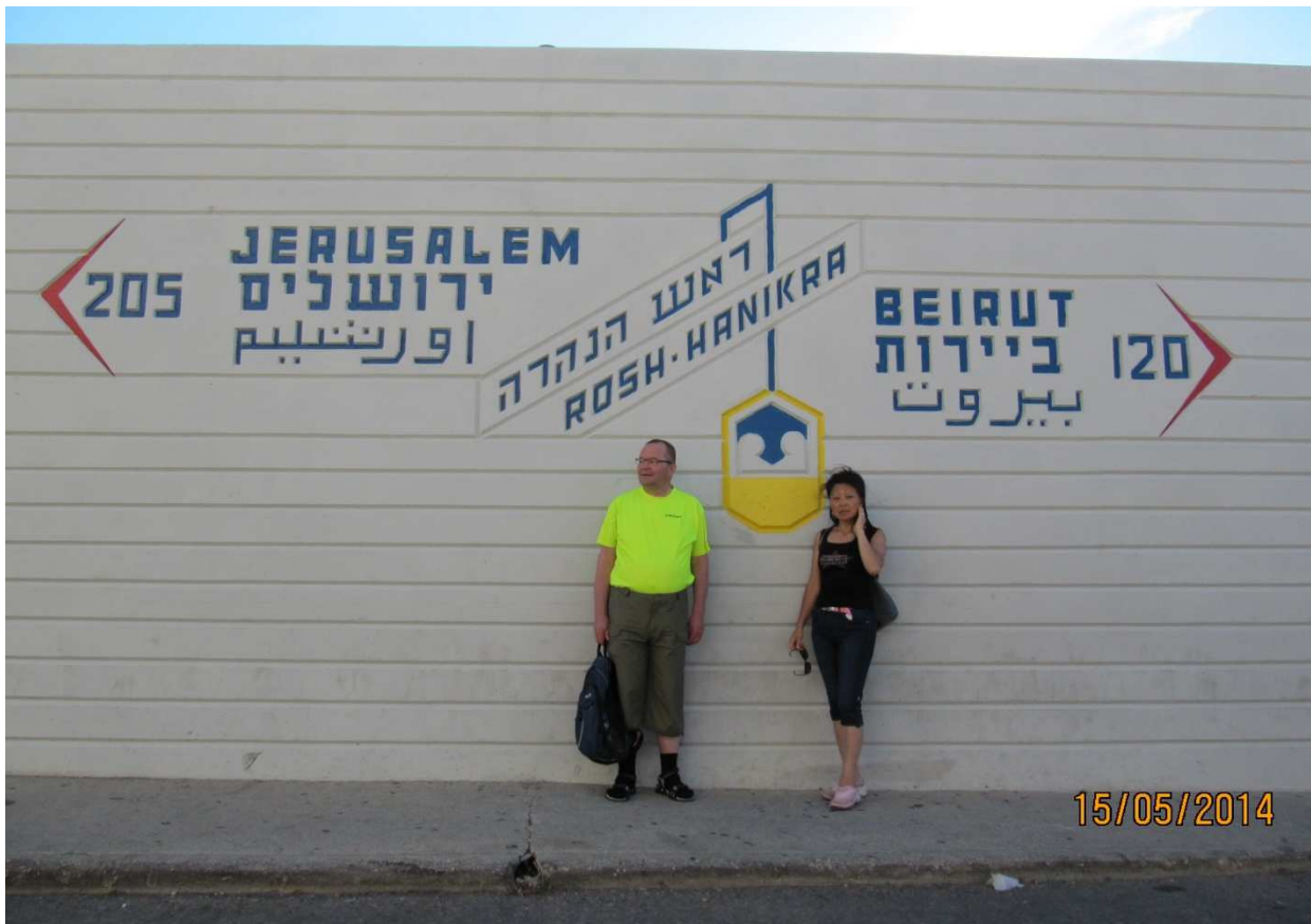
Kuvassa kirjoittaja hyvässä seurassa Lähi-Idässä

innolla mukana ja historia ja legendat ja tarinat olivat keskenään sidottu mielenkiintoisesti yhteen. Retkipäivän aikana käsiteltiin Lähi-Itää, sen pyhiä kaupunkeja, Jeesuksen elämää, kuljettiin pätkä Via Dolorosaa, käsiteltiin hänen lynkkausprosessinsa kulkua ja pysähdyttiin Golgatan-kukkulan oletetulla paikalla. Sain seurata tätä esitystä suoraan ja erinomaiselta aitiopaikalta. Mikä erinomainen tilaisuus minun tapaiselle perusateistille kuunnella tyylipuhtaat kootut selitykset miksi juuri meidän uskontomme tietää kyseisen asian muita paremmin, miksi paikka on vain meille pyhä. Välillä opastus oli jopa huvittavaa, ja jokainen hiukankin asiaan perehtynyt vapaa-ajattelijan tavoin asiat ymmärtävä huomasi, kuinka näitä asioita täytyy suodattaa tiheällä seulalla pitäen pää kylmänä.