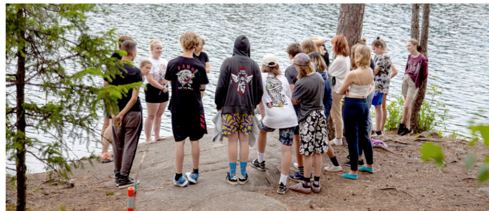
Protuleiri Nuuksiassa.